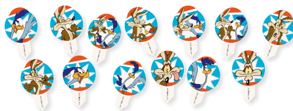
200 DECOSHAPE (ostie decorative per gelato)

Per avere 1 kit in omaggio è sufficiente acquistare: