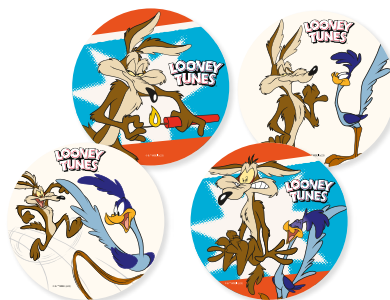
18 OSTIE GRANDI PER SEMIFREDDI